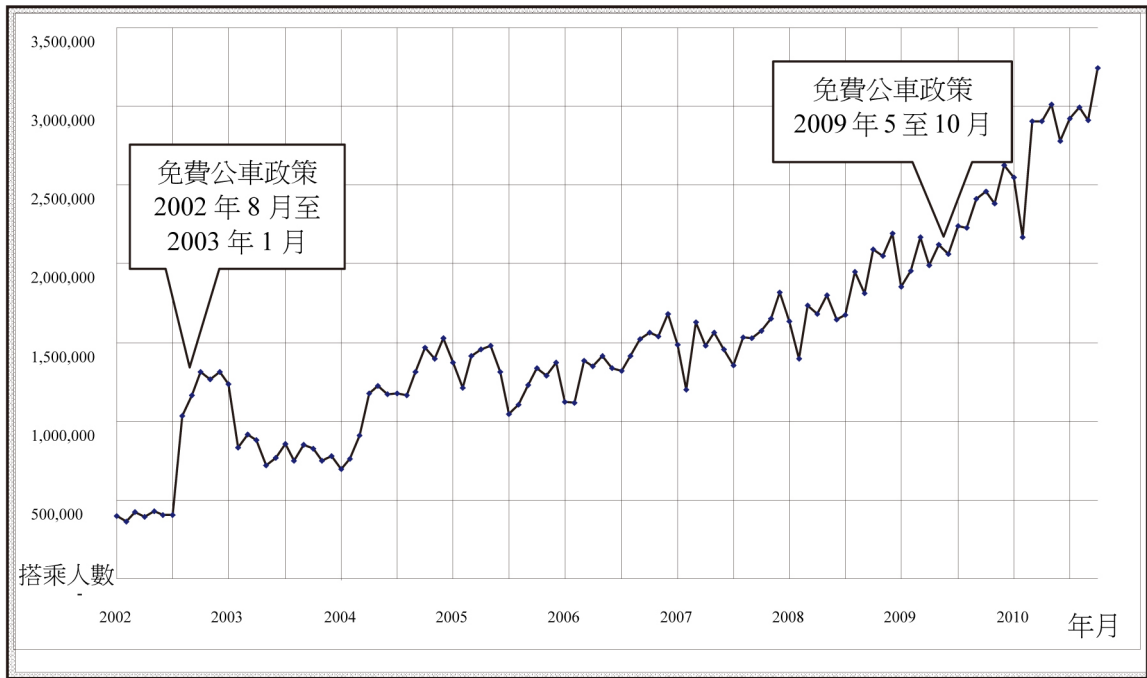
圖 2 臺中市公車每月搭乘人數